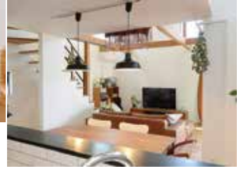
カウンターキッチンから一望できるリビング&ダイニング。吹き抜けの大きな窓から光が差し込み、室内を明るく照らす。スケルトンの階段も抜け感があって素敵

主に、家の設計に取り組んだのはご主人。家の中を見れば、その趣味や趣向が至るところに反映されているのが分かる。それが色濃く反映されているのが、玄関回りと2階のリビング・ダイニング&キッチン。玄関を入ると、まるでサーフショップのようなしやれた土間スペースが広がる。サーフィンや山登りなどの外遊び道具、物づくりが好きなご主人