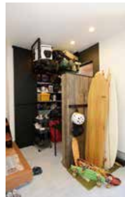
玄関の右側には山登りやキャンプ、大工道具をディスプレイしながら収納。広い土間はちょっとした作業スペースにも最適