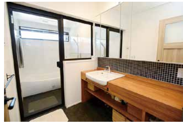
(上) つくり付けの洗面台にタイルの壁がおしゃれ。洗面所と一体感のあるガラス張りのバスルームも素敵。(右奥) 広々としたカウンターキッチン。後ろは全面収納で、家電から食器まですっきりと収まる。(右手前) ロフトスペースは子供たちの秘密基地