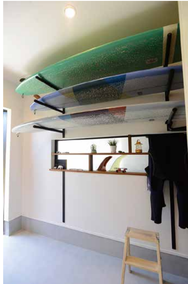
(上) 10畳ほどの土間スペースはロングボードが収まるように設計。灯り窓がアクセントになり、空間に抜け感をプラス。(下右) リビングからつながるウツダスペース。ここで食事したり、くつろいだり。普段の日常に変化を与えてくれる。(下左) 玄関横には2階のウツダスペースに上られる階段も

主に、家の設計に取り組んだのはご主人。家の中を見れば、その趣味や趣向が至るところに反映されているのが分かる。それが色濃く反映されているのが、玄関回りと2階のリビング・ダイニング&キッチン。玄関を入ると、まるでサーフショップのようなしやれた土間スペースが広がる。サーフィンや山登りなどの外遊び道具、物づくりが好きなご主人