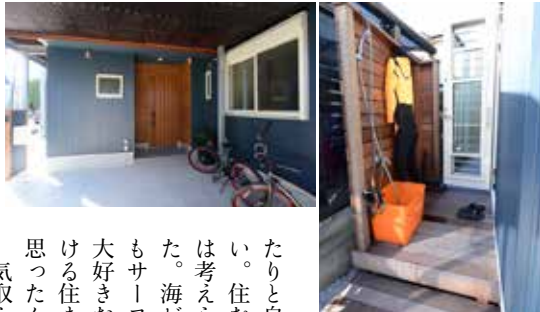
(右) 洗面所とバスルームに直接アクセスできるシャワースペース。 (左) ガルバリウムの外壁に木目の玄関扉、モルタル床がマッチ

な暮らし。ネイビーカラーのガルバリウムの外観、ゆるやかにつながる絶妙な間取りを見れば、快適な日常が垣間みれる。調和の取れた空間は、