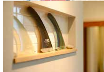
(上) ロフトからリビングを見下ろした様子。無垢のフローリングがナチュラルな印象。センスのいい家具がよく似合う。(左) 1階のサーフボード置き場の壁面には飾り棚を設置。サーフボードとリンクするように飾られたフィンのオブジェがおしゃれ。

たりと自然体なのがい。住むならもう都内は考えられませんか？海が近く、いつでもサーフィンができて、大好きな車も敷地に置ける住まいにしたいと思っただけです。