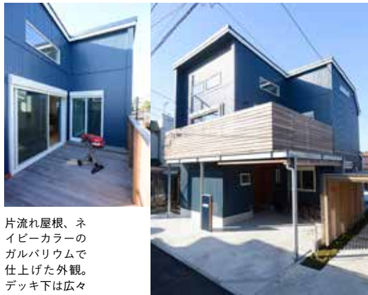
片流れ屋根、ネイビーカラーのガルバリウムで仕上げた外観。デッキ下は広々とした駐車スペースも

リビングを囲むL型バルコニーウッドデッキ。友人たちとバーベキューしたりと楽しみが広がる