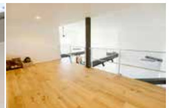
(上) キッチン上にはロフトスペースが。友人が泊まった際に便利だそう。(左) オールステンレスのカウンターキッチンにヴィンテージ感を出した黒い銅板製の照明がアクセントに