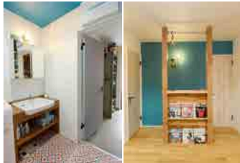
(右) リビング横には子供部屋が。飾り棚をつくり付け、少し奥まったところに配することで、空間を上手に区切っている。(左) 玄関からもつながるパウダールーム。サーフィンから帰ったご主人が直接入れるようになっている

の念願にも近い。リビングに続いたカバードポーチは、窓を開け放せば、室内外問わず、子供たちが走り回れるのも魅力。2階のご両親とは居住空間を完全に分けながら、扉ひとつで行き来もできる。ここは木の味わいも家族の絆も、ゆるやかに成長していく住まいなのだ。