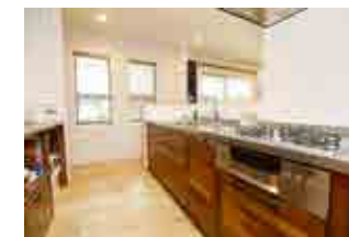
無垢の面材のシステムキッチンが空間にマッチ。壁面収納はオリジナルで製作