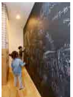
キッチン横の廊下には大きな黒板が。子供や訪れた人が気ままにいたずら書きするそう