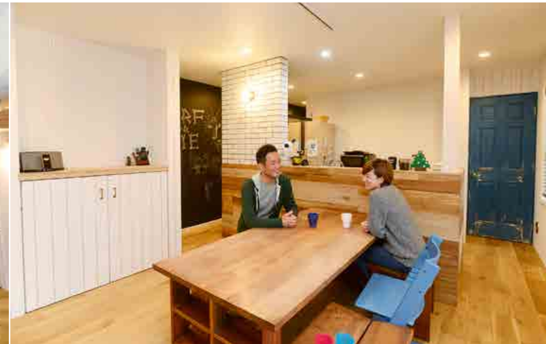
(右) 木の魅力を感じるダイニング・キッチン。キッチンカウンターは数種類のフローリング材を絶妙なバランスで貼り付け、空間に遊びを。(左) リビングは2階のご両親の間取りを生かし、吹き抜け構造に。平屋風ながら開放的