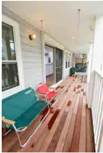
(上) リビングから玄関まで続く大きなカバードポーチは湘南人の憧れ。2階の両親や友人などとの交流の場にもなりそう。(下) 子供部屋は将来、ふたつに区切れる間取りに