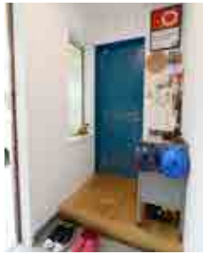
玄関はヴィンテージ風の無垢材の扉、スチール製のラックなどが楽しさを醸し出す

カラッととした陽が注ぎ、海風が吹き抜ける茅ヶ崎。Kさん邸は、そんな土地に似合うカリフォルニアのシーサイドハウスのような家である。Kさん家族と、奥様の両親が1階と2階に分かれて住む二世帯住宅で、東海岸の広々とした敷地に建てられた。サーフィンを愛するご主人のこだわりを、ハートフルホームとともに細部にわたって表現。ヴィンテージ感あふれる素敵な住まいに仕上げている。例えば、古きよきアメリカンスタイルを思わせるラップサイディングの外観。室内は、杉板の白い壁面がやわらかく空間を包み込む。カウンターキッチンや壁は、大ききや色合いが異なるナラ材やチーク材を貼り付けた。その他、壁一面の黒板やガス管をアクセントにしたラック、ヴィンテージ加工の扉など楽しい仕掛けもいっぱい。そのため、どこを切り取ってもとても絵になる。1階は、20畳を超えるリビング・ダイニング&キッチン、子供部屋や寝室、洗面所が緩やかにつながり合う。それは、「地面に近い、平屋のような家が理想だった」というご主人