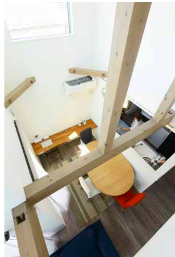
(上、右下) 室内に浮いているようなロフトからの眺め。4m近い天井に梁を渡し、開放的で空気がよく通る。(左下) 1階の寝室。壁一面にブルーをあしらひ、洗練された空間に。1階の子供部屋も青と白で仕上げた