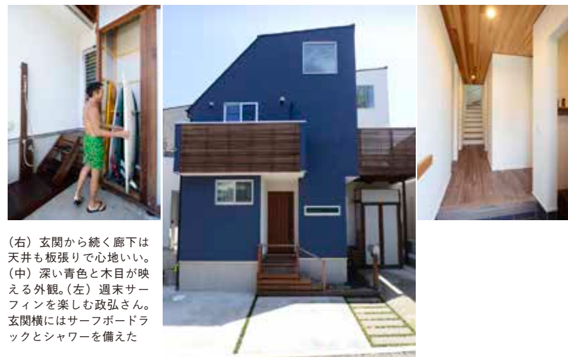
(右) 玄関から続く廊下は天井も板張りで心地いい。(中) 深い青色と木目が映える外観。(左) 週末サーフィンを楽しむ政弘さん。玄関横にはサーフボードラックとシャワーを備えた