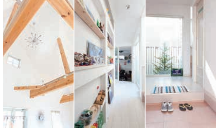
「採光窓や勾配天井など、明るく開放的な空間への工夫がいっぱい」

「明るい家にしたかったので、玄関や風呂など暗くなりがちな場所でもできる限り、抜け感や採光窓を備えました」とご主人。(左) リビングは勾配天井になっており、赤松の梁、シャンデリアがアクセントに。(中) 奥様のポップな雑貨が飾られた1階の廊下の飾り棚。(右) 玄関の正面には裏庭が見え、横からガレージにもつながる