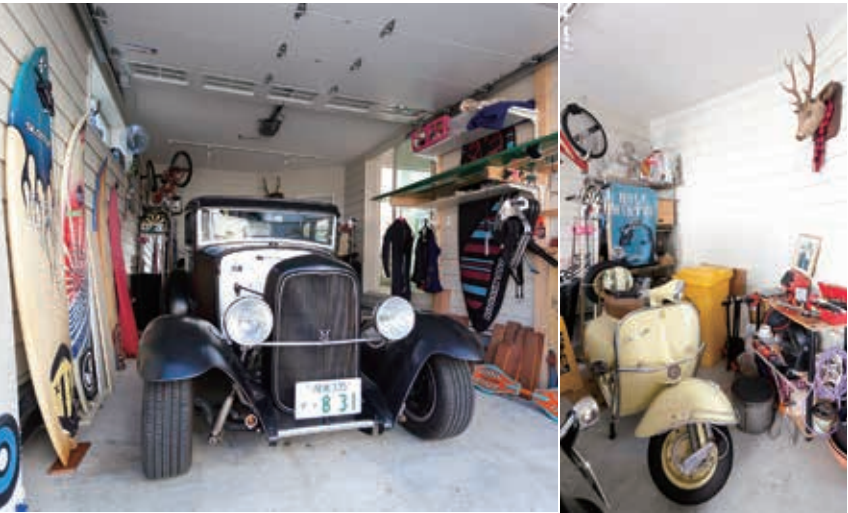
こだわりのガレージには、珍しい「フォード モデルA」がびったりと収まる。このほか、サーファーのご主人がこれまでに使ったサーフボード、ベスパ、雑貨なども。「ガレージはまだまだ作り込み中。看板や工具などを増やしていく予定です」