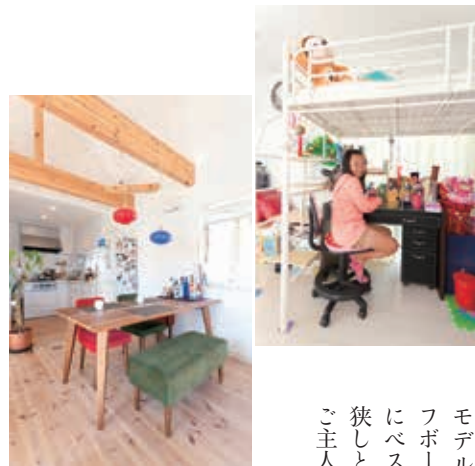
(右上) 1階の寝室兼子供部屋。将来、仕切りを付けて部屋を区切ることでもできる

「明るい家にしたかったので、玄関や風呂など暗くなりがちな場所でもできる限り、抜け感や採光窓を備えました」とご主人。(左) リビングは勾配天井になっており、赤松の梁、シャンデリアがアクセントに。(中) 奥様のポップな雑貨が飾られた1階の廊下の飾り棚。(右) 玄関の正面には裏庭が見え、横からガレージにもつながる