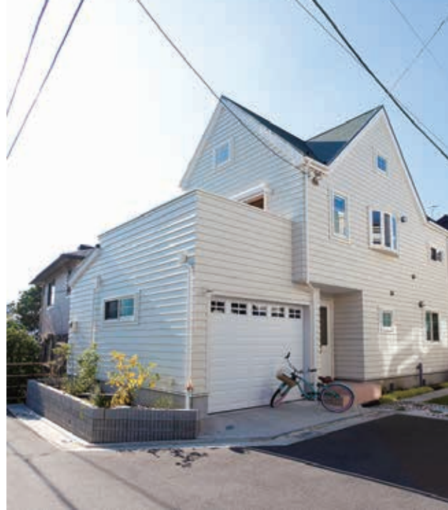
欧米で受け継がれてきたラップサイディング工法による外壁。真っ白な壁面に深緑の屋根が映える。アメリカでよく見られるガレージのシャッターが一層、アメリカな雰囲気を醸し出している