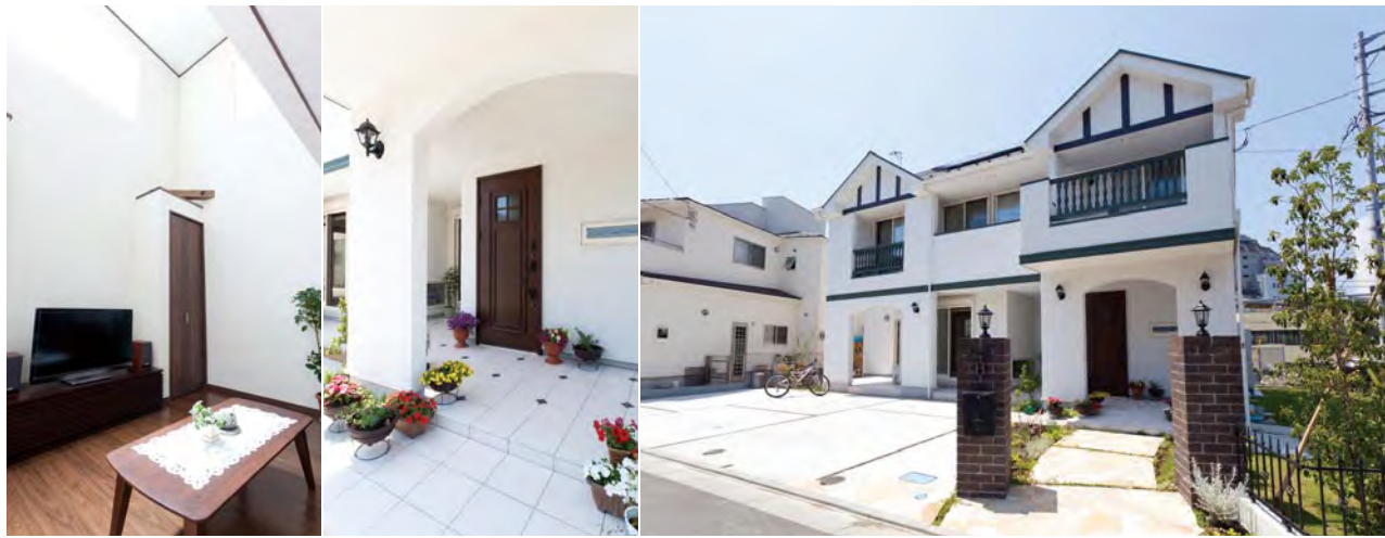
(右) 白い外壁に太い柱、特注で深いグリーンに仕上げたベランダの手すりなどが、まるで洋館のような重厚感ある佇まい。(中) 広々とした玄関スペースには美しい花が飾られ、やさしい雰囲気を醸し出している。(左) 吹き抜けのあるリビングスペース。木目の扉が印象的な収納スペースが、空間のアクセントに