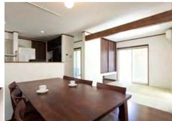
(上) 1階はリビング、キッチン、和室が見渡せる開放的なスペース。4畳半の和室には四方に窓が設けられ、明るく居心地がいい。外のポーチにも出入りできる。(左) 2階には3つの子供部屋が並ぶ。シンプルで清潔感があり、アレンジしやすい空間だ