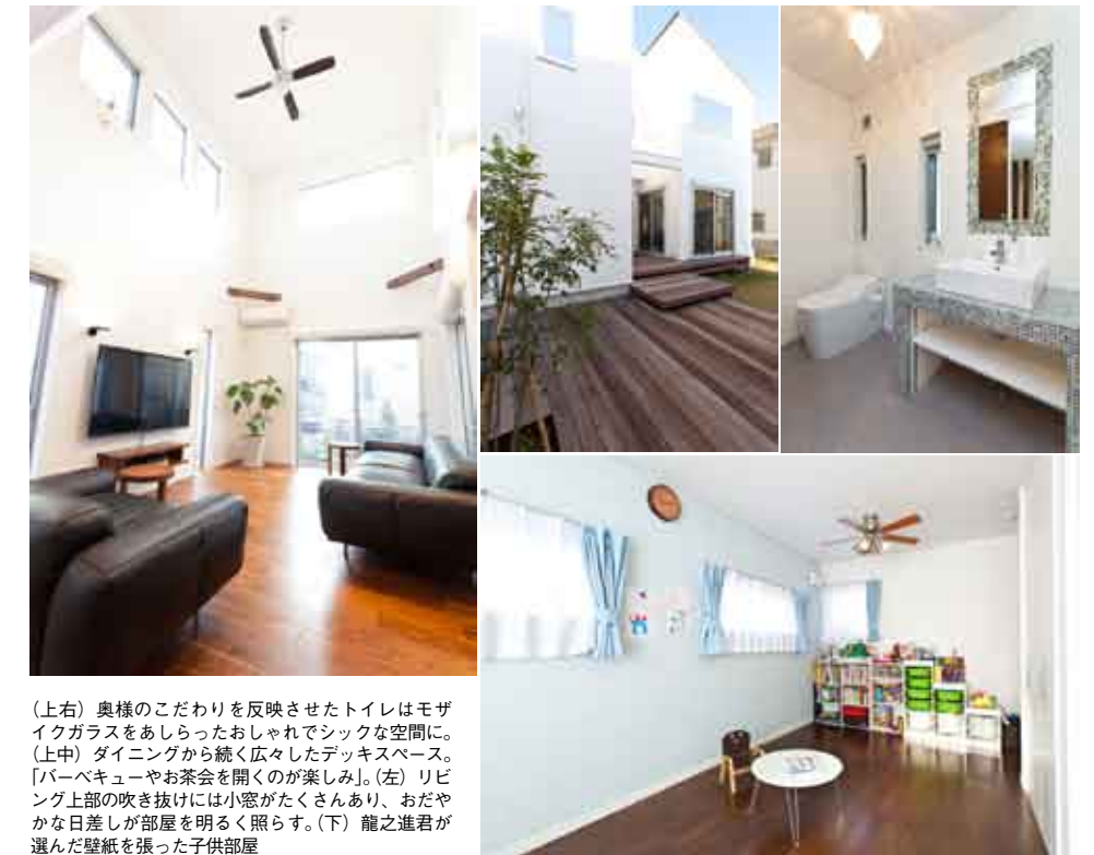
(上右) 奥様のこだわりを反映させたトイレはモザイクガラスをあしらったおしゃれでシックな空間に。 (上中) ダイニングから続く広々としたデッキスペース。「バーベキューやお茶会を開くのが楽しみ」。(左) リビング上部の吹き抜けには小窓がたくさんあり、おだやかな日差しが部屋を明るく照らす。(下) 龍之進君が選んだ壁紙を張った子供部屋