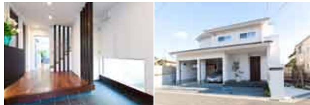
(右) 白を基調とした端正な外観。ガレージの奥から直接キッチンへ荷物を運び入れることができる。(左) ゆったりと広く、ラグジュアリーな玄関。玄関横にシューズクローク、階段下にも収納をつくり、いつでもすっきりしている