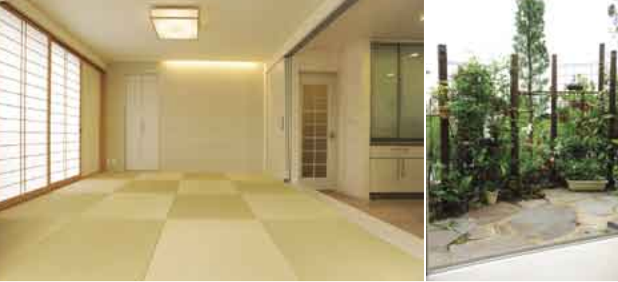
(右) リビングの窓から望める庭は室内の目隠しの役目も。寿代さんが育てている何種類ものバラや草花がたくさん植えられ、「いずれはバラ園のようにしたい」という。(左) 和室は琉球畳にし、隣接したリビングにも合うモダンな雰囲気を出している