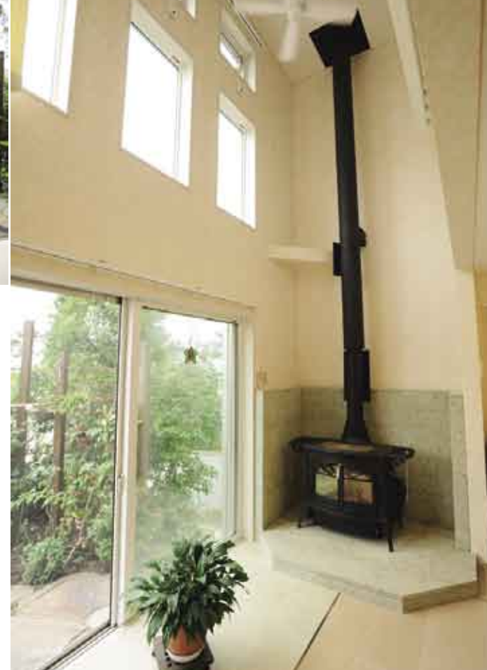
吹き抜け空間には薪ストーブも備え、冬には家全体をあたためてくれる。緑側は趣味の園芸がしやすいように、タイル張りにしている