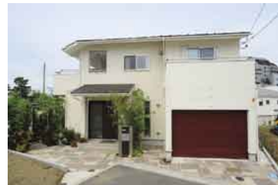
ベージュとホワイトを基調にした外観。ガレージにはウッディーな雰囲気の扉でアクセントを付けた。裏まで続く庭で家を囲み、自然豊かな空間に

(上) リビング、キッチン、ガレージをつなぐ土間スペース。ガレージからそれぞれの部屋に行き来でき、車から荷物を運び入れやすい。(下右) 富士山を望める広々としたルーフバルコニー。「いずれバスタブを設置して、露天風呂にするのが楽しみ」だそう。(下左) 階段は巾が広く、ゆったりとしており、軽快に昇り降りできる