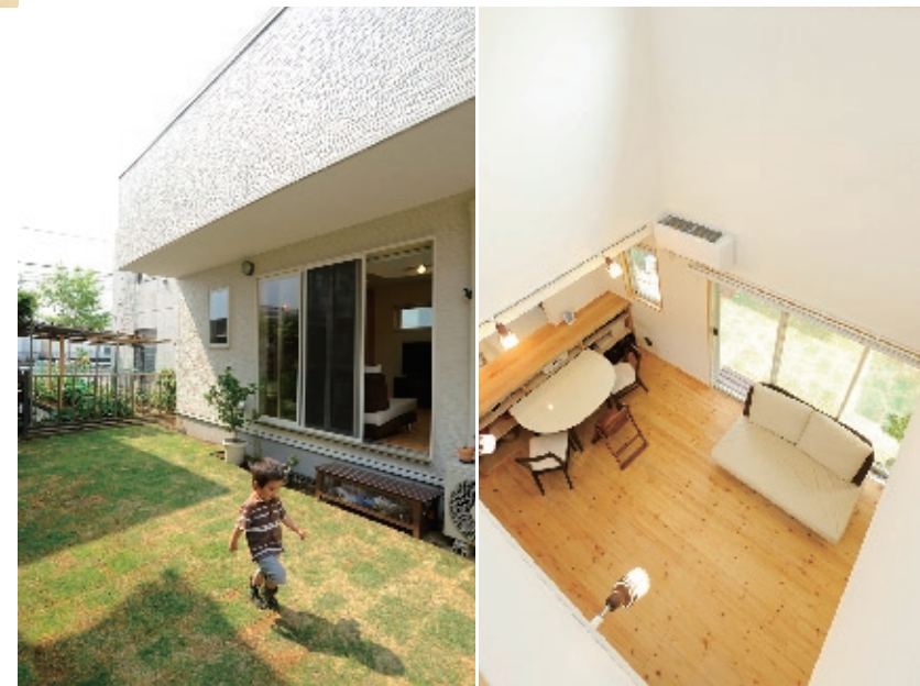
右) 吹き抜け構造で家全体が明るい印象に。2階の廊下からリビングが見渡せる。左) 50坪の敷地にはリビングに面した庭も。家庭菜園でネギやジャガイモを育てており、将来はウッドデッキも取り付けるなど、楽しみが広がる

「オール電化にしたんですが、以前の住まいより電気代が安く、電気も生成しながらランニングコストもかからないので助かっています。」と旦那さまもご満悦だ。ナチュラルに心地よく住めるFさん邸は、時とともに新たな表情に変化していくだろう。