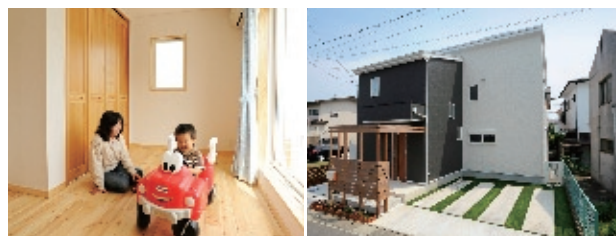
右) 白と黒の外壁が一際目立つ外観。玄関の周囲にはウッドフレームをあしらった、ナチュラルな屋内を連想させながら目隠し効果も。左) 2階には子ども部屋と寝室を設置。子どもの成長に合わせて、コーディネートしやすいシンプルな空間に仕上げた