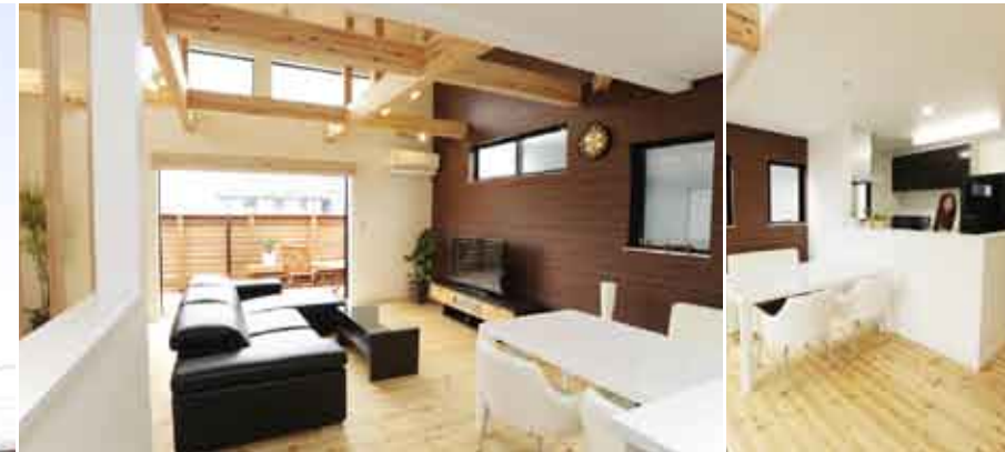
上)壁の1面にはご主人こだわりの木目の壁材をあしらった。これにより、部屋全体が引き締まり、落ち着いた空間になった。右上) オープンキッチンは白い壁でキッチン内部を覆い、すっきりと開放的に仕上げた