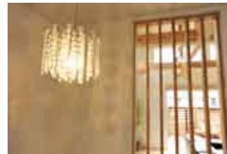
右) 2階奥にある洗面所には、いろいろと探しまわってようやく見つけたという大きな鏡を設置した。これにより、広さを感じる洗面所に。上) ハートフルホームの提案により、階段からリビングが見渡せる格子窓を備え、階段まで明るい光が降り注ぐ