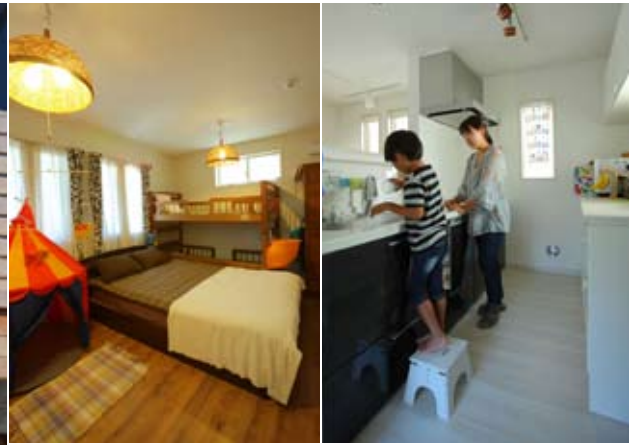
右) お手伝い中の祥汰くん。すぐ近くにパントリーとサービスバルコニーを設け、食材やゴミを置かないキッチンにした。中) 1階の寝室は将来子供部屋に。左) 奥に広いM邸。マンションの便利さを採用し、不在時のための宅配ボックスを設置