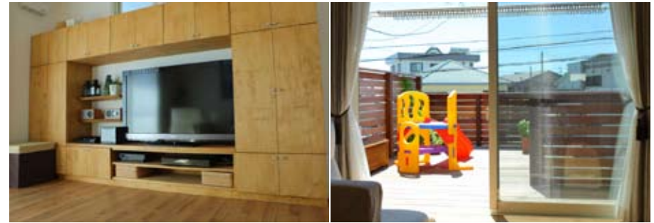
右) 広々としたデッキ。照明も付け、友人たちと日暮れのパーティーも楽しめる。左) 収納とインテリアを兼ねた作り付けのテレビボード。リビングを引き締めている