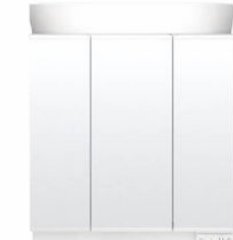
スタンダードLED照明・3面鏡・全収納 MEB-903TXSU