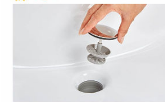
排水口の中までスポンジでサッとお掃除できます。水を通しやすい大口径φ55の排水口です。