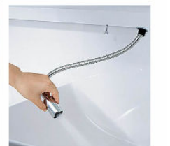
ホースを引き出して使えるので、ボウル手前に水を流すこともできます。