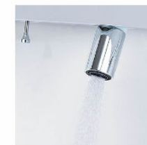
シャワー吐水 水ハネの少ない微細シャワーは従来比の20%の節水ができます。