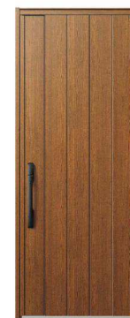
KE: キャラメルチーク