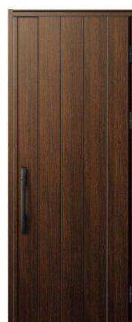
Z9: ショコラウォールナット

ストリートノック ソフトライトタイプから8mm厚のタイプまで対応するストリートノック