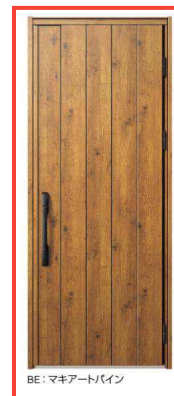
BE: マキアート パイン