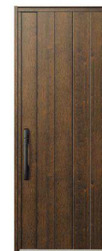
DP: ガナッシュウォールナット