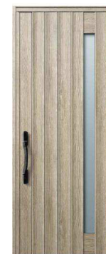
XP: ココナッツチェリー