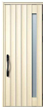
JJ: パニラウォールナット