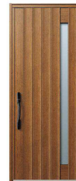
KE: キャラメルチーク