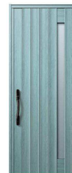
BJ: アイスブルーノーチェ