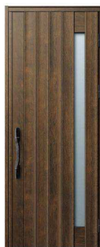
DP: ガナッシュウォールナット