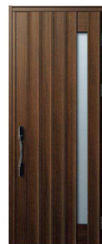
Z9: ショコラウォールナット