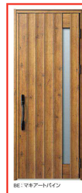
BE: マキアートパイン