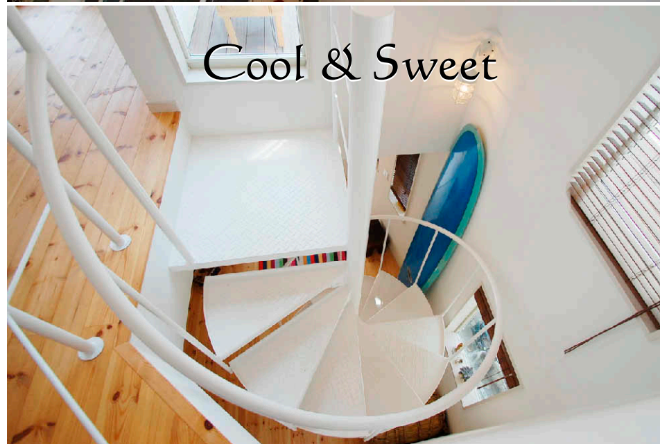
Cool & Sweet