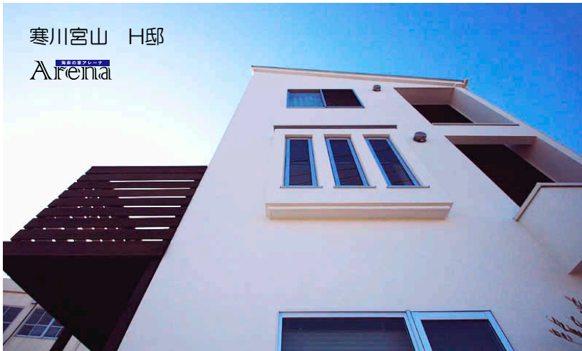
寒川宮山 H邸 Arena